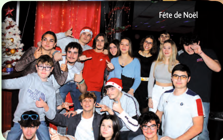
Fête de Noël